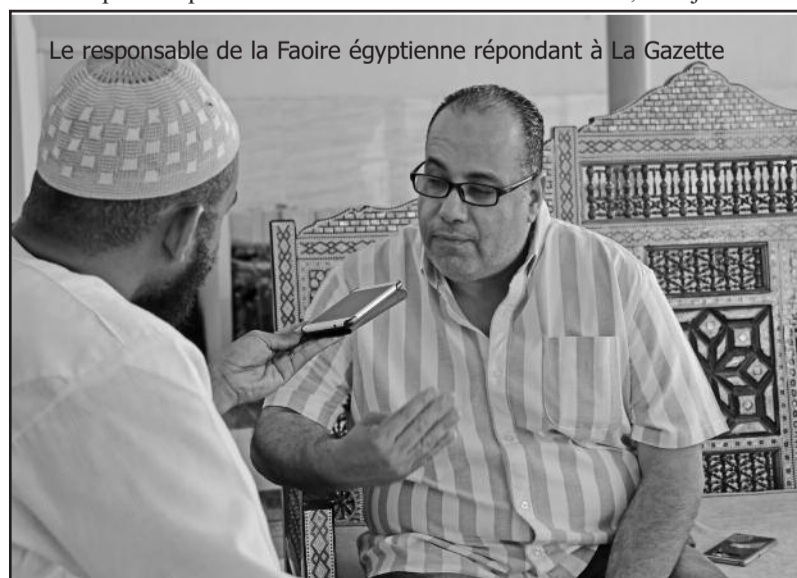
Le responsable de la Foire égyptienne répondant à La Gazette